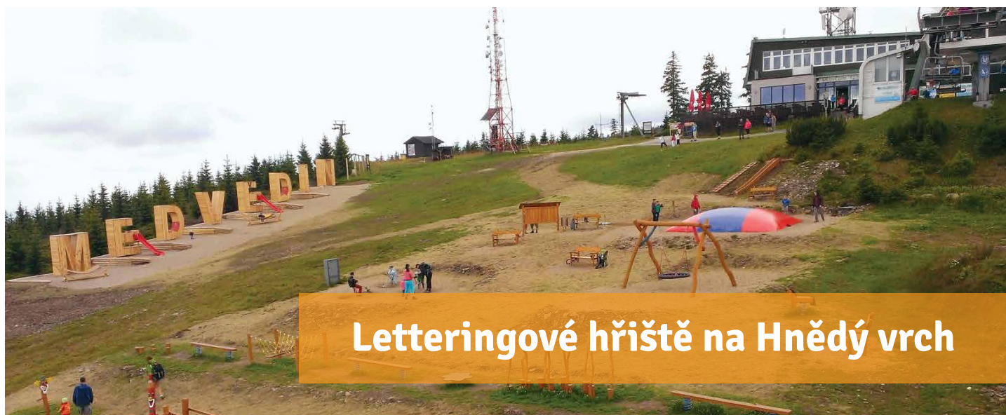
Letteringové hřiště na Hnědý vrch

Budeme podporovat aktivity vedoucí k propojení lyžařských areálů ve Velké Úpě a Peci přes Javoří důl. Tento záměr je zakotven ve stávajícím územním plánu a jde o klíčový projekt pro rozvoj lyžování v Peci pod Sněžkou.